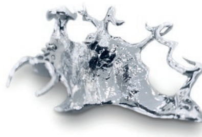
Verschleiffen & poliert