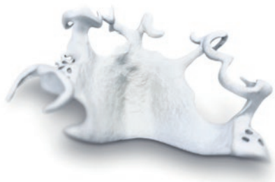
Gestrahlt & verschliffen